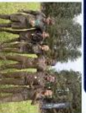
DÉPASSÉMENT DE SOI