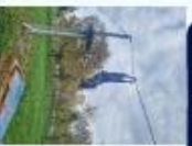
ACTIVITÉS DE COHÉSION

★ S'ENGAGER POUR COMPRENDRE, COMPRENDRE POUR S'ENGAGER !