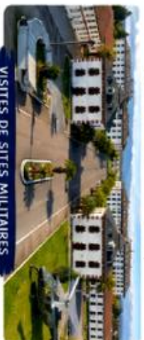
VISITES DE SITES MILITAIRES