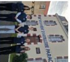
VISITE ET RENCONTRE