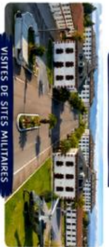
VISITES DE SITES MILITAIRES