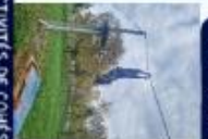
ACTIVITÉS DE COHÉSION

★ S'ENGAGER POUR COMPRENDRE, COMPRENDRE POUR S'ENGAGER !