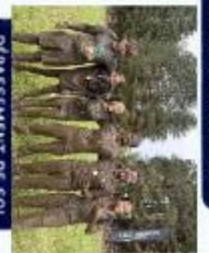
DÉPASSÉMENT DE SOI