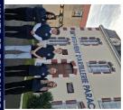
VISITE ET RENCONTRE