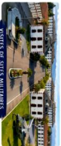
VISITES DE SITES MILITAIRES