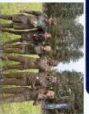
DÉPASSÉMENT DE SOI