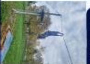
ACTIVITÉS DE COHÉSION

★ S'ENGAGER POUR COMPRENDRE, COMPRENDRE POUR S'ENGAGER !